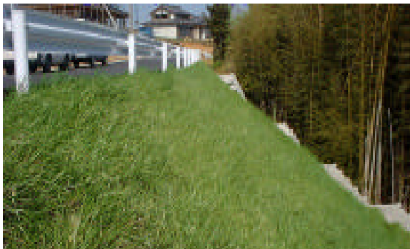
平成12年4月11日 春の状況