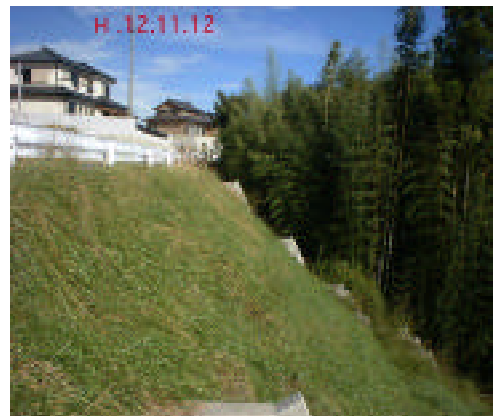
平成12年11月12日 冬の状況